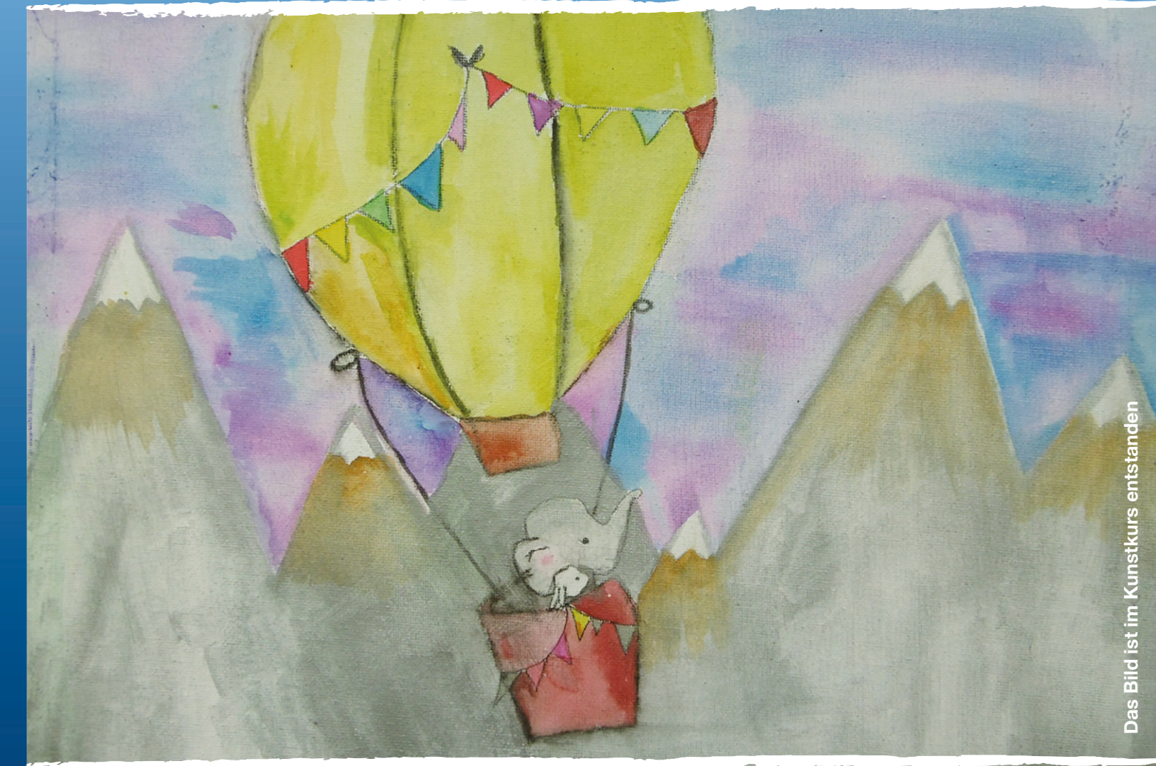
Das Bild ist im Kunstkurs entstanden