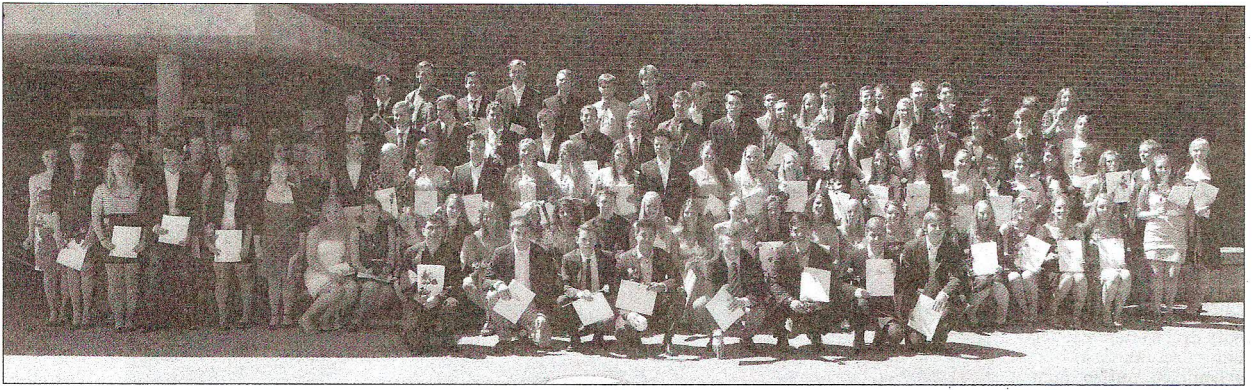
109 junge Frauen und Männer haben am Kaltenkirchener Gymnasium ihr Abitur bestanden. Gestern erhielten sie ihre Reifezeugnisse überreicht. Danach stellten sie sich vor der Sporthalle zum Gruppenfoto auf.